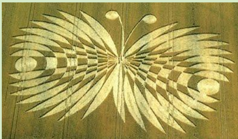
Velkolepý motýli kruh v obilí se objevil v Hailey Wodd, poblíž Ashbury, v anglickém Oxfordshire, 16. července 2007.